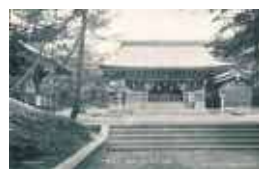
戦時中の絵はがき