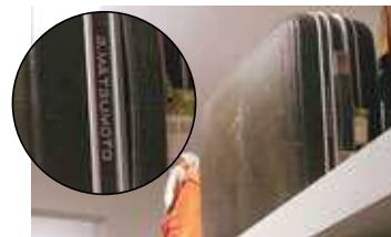
◀ 持ち手のとなりに名前が見える

誰が名付けたか「蔵書の森」。書籍が増えるにしたがって増築された書庫はまるで迷路のよう。ガラス越しには見えない書庫の奥まで2階のモニターで見られます。また、書庫の本のタイトルは「情報ライブラリ」で見ることができます。