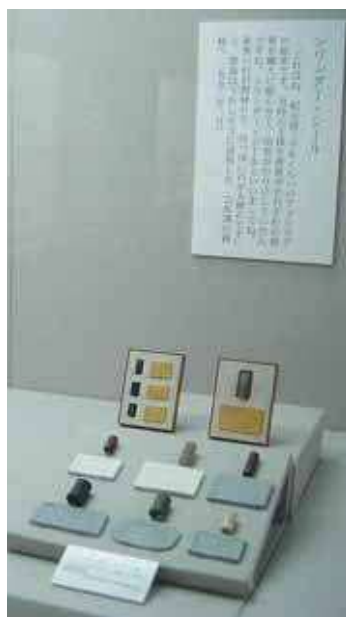
シリンドラー・シール(円筒印章・イラク)

東京都三鷹市大沢3-10-31 Tel: 0422-32-7111 Fax: 0422-31-9453 http://www.meccj.or.jp