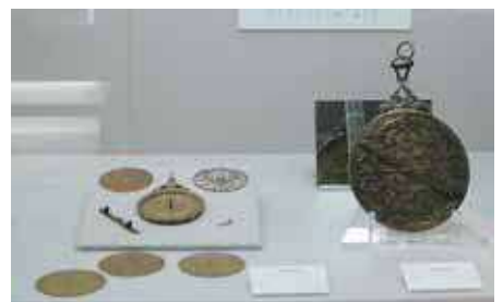
天体観測儀(イラン)