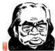
イラスト:山藤 章二