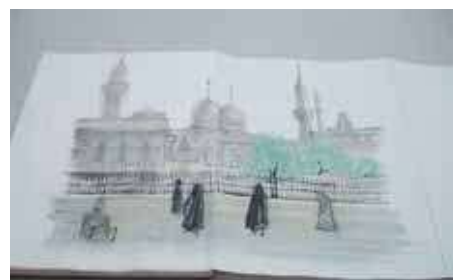
モスク風の建物のスケッチ画(画・松本清張)