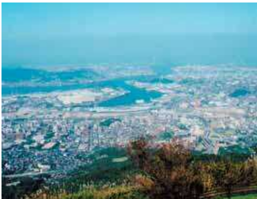
皿倉山からみた八幡の町

少年時代から旅に憧れを持ちつづけた清張の長年の夢は、日本中の自分の作品の舞台を上空から眺める、というものでした。晩年、中江利忠氏（当時朝日新聞社社長）の協力で実現したとき、セスナ機内で青年のように喜んだそうです。カメラのファインダーを覗く清張の胸中には、どんな思いが去来していたのでしょうか。