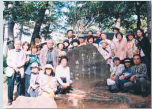
ドラマ紀行 能登金剛 清張歌碑の前で

十一月八日からは、「砂の器」の舞台・島根県亀嵩を訪問しました。また、市内の主要書店で七月から八月にかけて清張作品ブックフェアが、映画館では八月から十月まで、「松本清張／映像の軌跡」と題して連続十一週にわたり、二十二本の清張原作映画が上映されました。